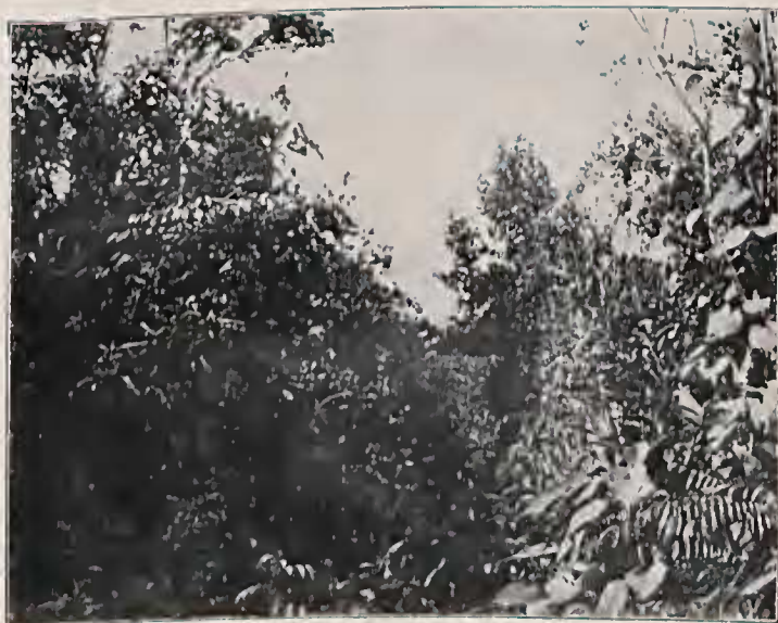
Habitats no Distrito de Itaquaquecetuba, Estado de São Paulo